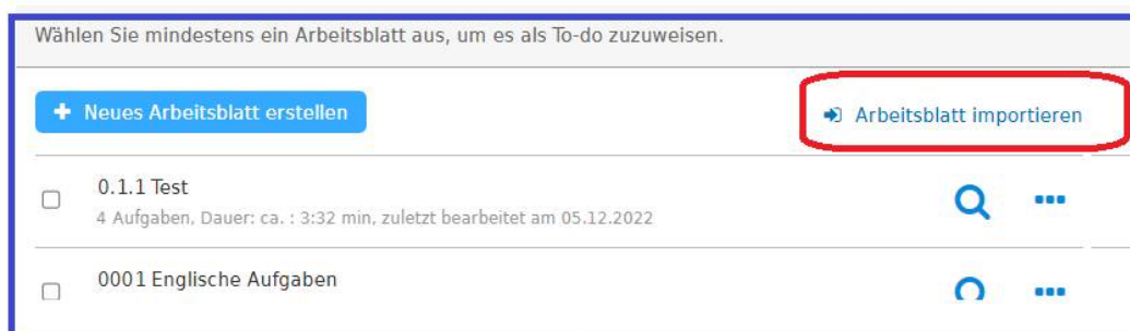
Screen: Arbeitsblätter importieren

Bei Fragen stehen wir Ihnen gerne unter 030-300 244 000 oder kontakt@bettermarks.com zur Verfügung