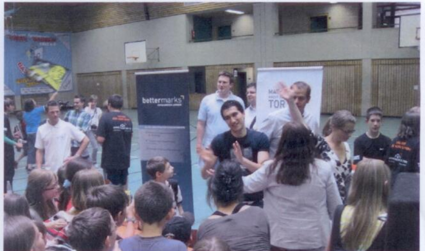
Einmal ist Schluss: Nuri Sahin verabschiedete sich gut gelaunt aus Treis-Karden.