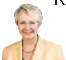
VON ANNETTE SCHAVAN

Fortschritte sind eine Aufgabe der ganzen Gesellschaft